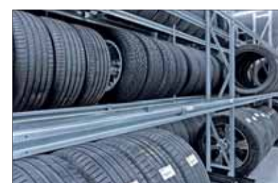
Fachmännische Betreuung und Einlagerung: Reifenhotels bringen den Automobilisten viele Vorteile.