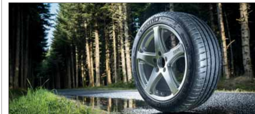
Mit Sommerreifen wird der Bremsweg kürzer, die Fahrt agiler.