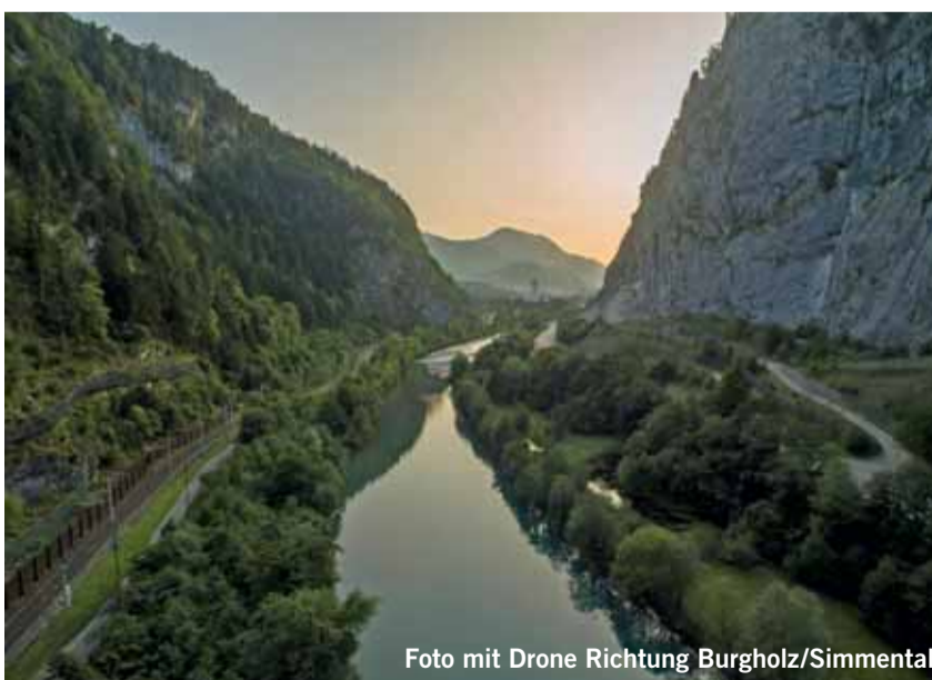
Foto mit Drone Richtung Burgholz/Simmental