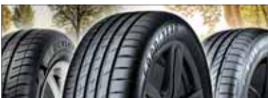
Sommerpneus haben ein flaches Profil mit Rinnen zum Wasserabfluss.

Jetzt ist die Zeit gekommen, die Sommerreifen aufziehen zu lassen. Denn die Temperaturen gehen nie mehr unter Null Grad und tagsüber liegen sie deutlich über zehn Grad. Wenn neue Sommerreifen benötigt werden, ist der AGVS-Garagist der richtige Ansprechpartner, er kennt nicht nur das Fahrzeug bestens, er weiss wahrscheinlich auch über den Fahrstil des Besitzers scheid.