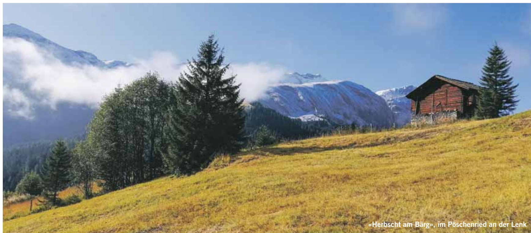
«Herbscht am Bär», im Pöschneried an der Lenk

Jedes publizierte Bild wird mit einem Einkaufsgutschein von Coop im Wert von Fr. 30.00 belohnt. Senden Sie Ihr Bild in genügender Auflösung an anzeiger@ilg.ch oder Simmentaler Anzeiger, Herrenmattstr. 37, 3752 Wimmis. Bitte mit Absender und kurzer Legende. Es wird keine Korrespondenz geführt.