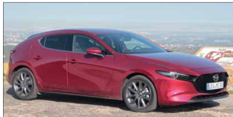
Mazda3: Der Neuling brilliert mit klar definierten Rundungen. RHo