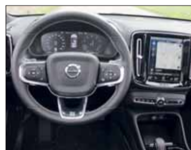
Digitalisiert: Der XC40 geizt nicht mit inneren Reizen – toll gemacht.

Der Volvo Einheitsmotor leistet als T5 247 PS, klar dass dies für den leer nur rund 1700 Kilo wiegenden XC40 zu ausgezeichneten Fahrleistungen reicht. Dabei ist der Neuling mit einem Fahrwerk bestückt, das höchsten Komfort auf jeder Oberfläche bietet. Der Allradantrieb gestattet ihm ohne weiteres auch Abstecher neben die Strasse. Weil Volvo gerne alles etwas anders macht, gibt es den XC40 auch im Abonnement «Care by Volvo» ab 500 Franken. Aber leider nur ausgewählte Varianten. Der T5 R-Design kann nicht abonniert werden. RHo