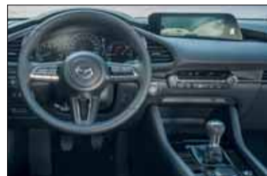
Hochwertig: Die Interieurgestaltung des Mazda3 wirkt schlicht-modern.

mit elektrischer Unterstützung angetrieben. 6-Gangbox oder Automat stehen zur Wahl. Später kommt die Einzigartigkeit: Mazda3 Skyactive X. Bei ihm wirkt erstmals ein Selbstzünder-Benzinmotor mit 181 PS auf Wunsch auf alle vier Räder. Er arbeitet mit einer Verdichtung von 16,3:1. Die Preise für den Mazda3 (G und X) liegen zwischen 27'990 und 39'590 Franken. RHo