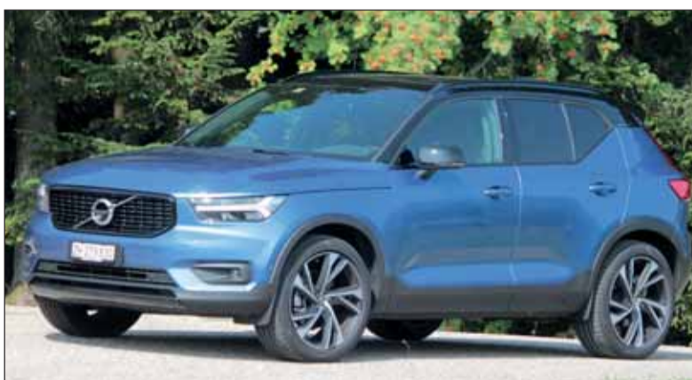
Voll gelungen: Der kompakte XC40 spricht eine eigene Formensprache. RHo