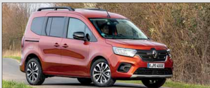
Renault Kangoo E-Tech: Jetzt sind alle Kangoo-Versionen elektrifiziert. zvq

Wohlverstanden, der elektrische Kangoo ist durch und durch ein Familienauto. Darum wird es später auch noch eine Langversion mit bis zu sieben Sitzplätzen geben. Der Elektromotor wird von einer 45 kWh-Batterie gespeist. Er generiert 90 kW und 245 Nm Drehmoment. Federung und Lenkung fühlen sich ausreichend präzise und komfortabel an. Die Reichweite wird mit 285 bis 340 Kilometer nach WLTP angegeben. Mit einem Preis ab Fr. 39'500.- sind zwei Ausstattungsvarianten bestellbar. RHo