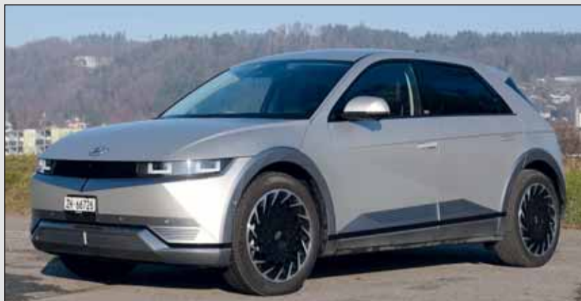
Elektrifizierend: Der gradlinig gezeichnete Hyundai Ioniq 5 passt gut. cj