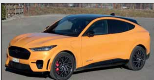
Ford Mustang Mach-E GT: Familien-Elektro-Renner.