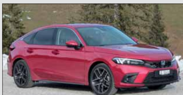
Honda Civic e:HEV: Eigene Wege geht Honda