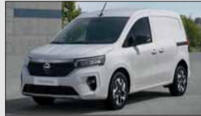
Elektrolieferant: Der neue Nissan Townstar Kastenwagen.

Der neue Nissan Townstar Elektro Kastenwagen (L1H1) ist bei den Schweizer Vertriebspartnern sofort verfügbar und kann bestellt werden, als EV45 11 kW ab Fr. 40'990.- und als EV45 22 kW mit CCS-Ladestecker (80 kW) ab Fr. 42'990.-. Die breite Palette an Komfort- und Sicherheitselementen ist von der Version mit Benzinmotor bekannt.