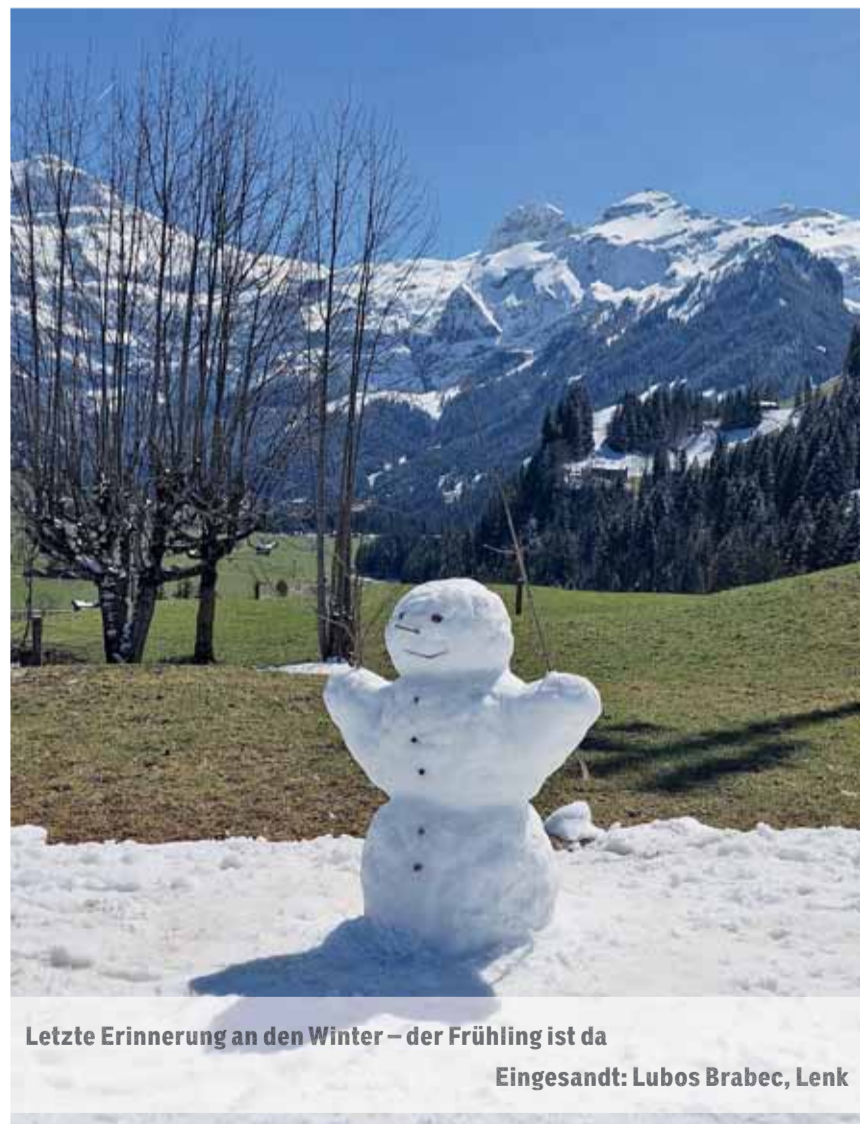
Letzte Erinnerung an den Winter – der Frühling ist da

Senden Sie uns ein schönes, originelles oder lustiges Bild und wir belohnen Sie mit einem Einkaufsgutschein von Coop im Wert von Fr. 30.–. Senden Sie das Bild in genügender Auflösung an anzeiger@ilg.ch oder Simmentaler Anzeiger, Herrenmattstr. 37, 3752 Wimmis. Bitte mit Absender und kurzer Legende. Es wird keine Korrespondenz geführt.