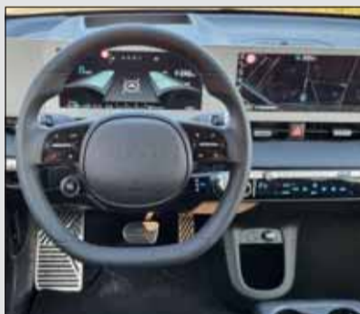
Gefällt: Modern, digital und doch leichtfässig; Innenraum Ioniq 5.

Die im Unterboden verbaute Batterie macht den Ioniq 5 zwar 2175 Kilo schwer, aber die hohe Leistung (325 PS/615 Nm) lässt dies die Insassen auch wegen dem tiefen Schwerpunkt nicht spüren. In jeder Situation und besonders auch im Winter findet die Reifen immer Halt. Mit dynamischer Beschleunigung, guter Rekuperation und tollem Navigationsgerät steuert der Ioniq jedes Ziel punktgenau an. Die Reichweite ist für den Alltagsgebrauch absolut ausreichend, so dass der mit allen Ladesystemen vertraute Hyundai ohne weiteres auch mal als Reisewagen eingesetzt werden kann. Die moderaten Preise für ein wirklich überzeugendes Gesamtpaket wird zudem von einer 5-Jahres-Garantie versüsst. RHo