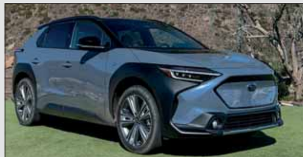
Subaru Solterra: Bizarrr karossiertes 4x4- Elektro-SUV.

In loser Folge zeigen wir Fahrzeuge, die den Schweizermarkt nachhaltig auffrischen dürften oder die bereits von einer Jury ausgezeichnet wurden. In der zweiten Übersicht stellen wir sechs Neuheiten vor, die bereits zu haben und auch lieferbar sind. Alle sind mindestens zum Teil elektrifiziert. RHo