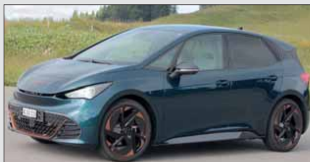
Cupra Born: Grosse Reichweite für Elektro-Erstling.