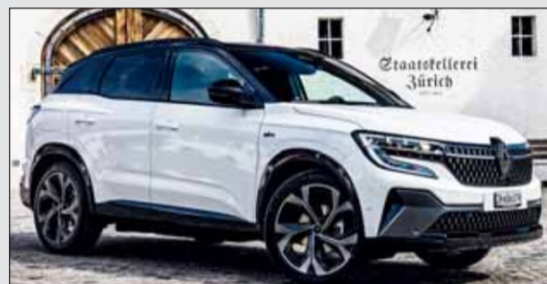
Renault Austral PHEV: Wendig durch Allradlenkung.