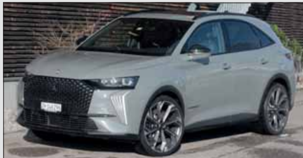
DS7 PHEV: Familien-SUV des Citroën-Ablegers.