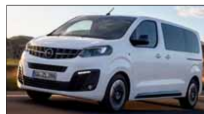
Neue Grösse: Opel Zafira Life

Opel Zafira Life: Multifunktional Der bisherige Opel Zafira war einzigartig flexibel. Durch die Zusammenarbeit mit PSA wird nun eine Konzernprodukt zum beliebten Minivan umfunktioniert. Der kann mit zwei Radständen, in drei Längen, bis zu neun Sitzen und sogar mit 4x4 bestellt werden. Als Antrieb dient ihm ein 1,5 Liter Turbodiesel mit 102 PS. Die Preise starten bei Fr. 34'310.-.