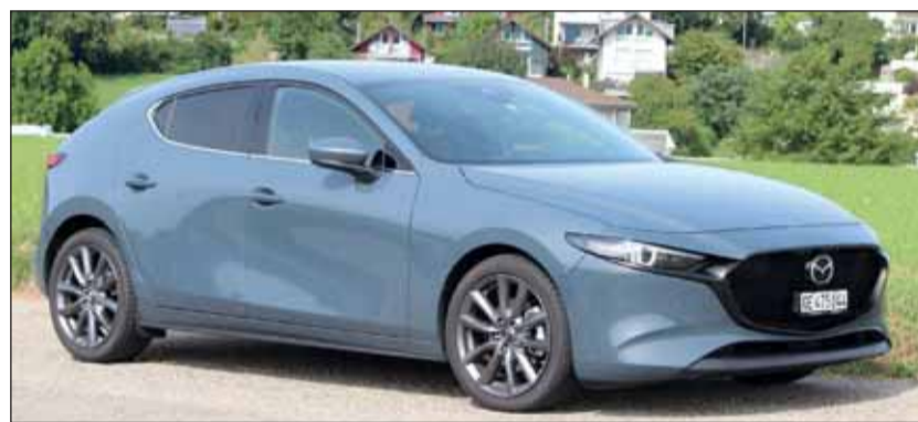
Einzigartig: Der neue Mazda3 ist schlicht, aber formvollendet.