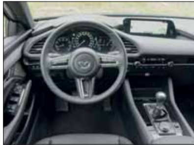
Das in dunklen Tönen gehaltene Interieur strahlt Wohlbehagen aus.

penmodell, das hohe Eigenständigkeit ausstrahlt. Innen finden fünf Erwachsene gut ausreichende Platzverhältnisse vor. In der höchsten Ausstattungsstufe Revolution bleiben hinsichtlich Sicherheit, Fahrerunterstützung, Konnektivität und Verarbeitung keine Wünsche offen. Zusätzlich war der Testwagen mit Ledersitzen ausgerüstet, die einen edlen Touch in das reichhaltig bestückte Interieur zauberten. Dazu gesellten sich viele Annehmlichkeiten.