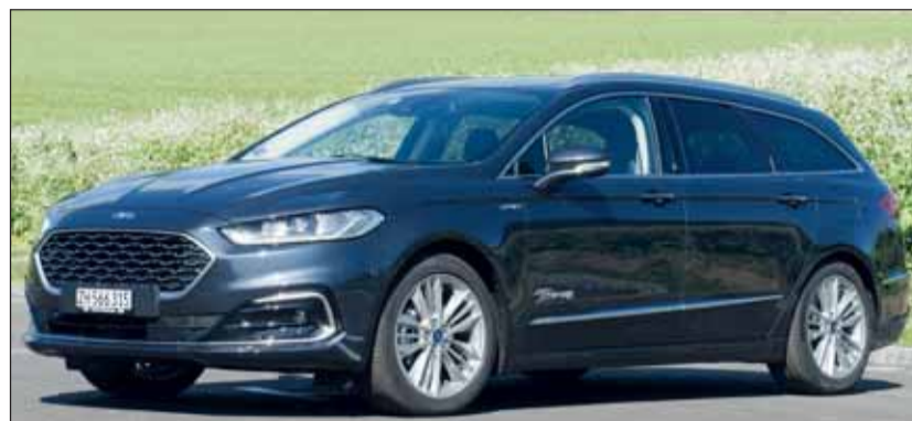
Grosser Kombi: Der Mondeo Turnier ist in der Schweiz ein Bestseller.