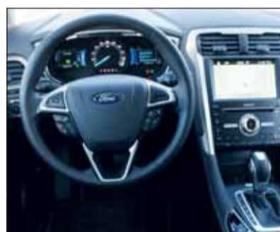
Klassisch, aber digital: Ford kommt mit wenigen Bedientasten aus.