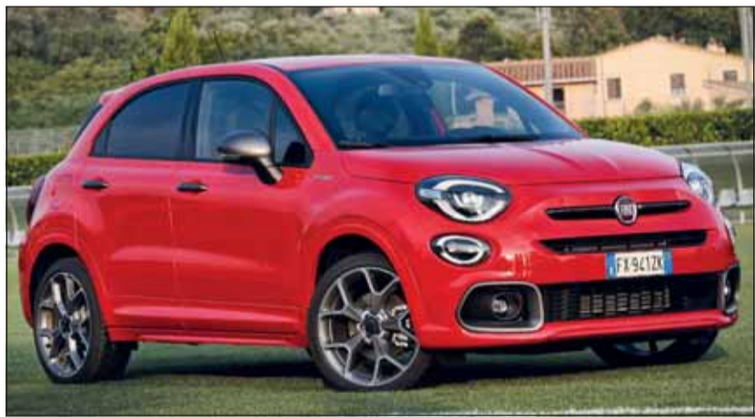
Sportmodell: Optisch verspricht der neue Fiat 500X Dynamik und Spass.