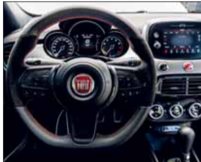
Wie im Sportwagen: Das Fiat 500X-Cockpit weckt Sportlergene.

Der neue Fiat 500X Sport wurde am historischen Sitz des italienischen Fussballverbandes FIGC in Florenz vorgestellt. Damit wurde die langjährige Partnerschaft unterstrichen und gleichzeitig der sportliche Anspruch unterstrichen. Aus dem Trainingslager ist der 500X optisch besonders dynamisch hervorgegangen. Innen