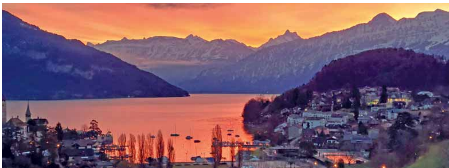
Morgenstund in Spiez