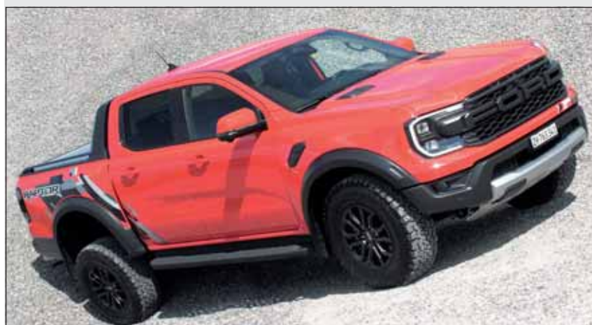
Kann alles: Der Ford Raptor bietet Fahrspass und Vielseitigkeit.

Der 3-Liter-V6-Motor leistet 292 PS. Knapp 500 Newtonmeter Drehmoment wirken auf die Kurbelwelle. Die Kraft wird über eine 10-Gang-Automatik an alle Räder geleistet. Das Fahrwerk des Raptor wurde stark überarbeitet. Hiervon zeugen unter anderem neue obere und untere Querlenker aus Aluminium. Die hohe Bodenfreiheit und kurze Überhänge sorgen für eine extreme Geländegängigkeit. Aber auch auf der Strasse überrascht das Pick-up durch souveräne Fahrleistungen und trotz den Stollenreifen für ausgezeichnete Fahreigenschaften. Bloss das Parkieren ist nicht immer einfach, soll das Fahrzeug mit dieser Breite in ein Feld gezwängt werden. Je nach gewähltem Fahrmodus ändert sich auch der Sound. Es ist eine wahre Freude, mit dem Raptor unterwegs zu sein, denn er ist Limousine, Geländewagen und Lastenträger zugleich und kommt wirklich überall hin.