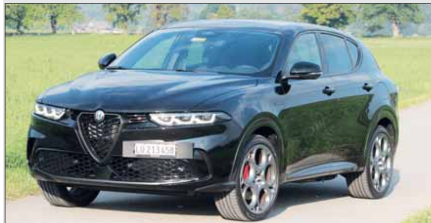
Modernes SUV: Der Alfa Romeo Tonale mischt den Markt tüchtig auf.