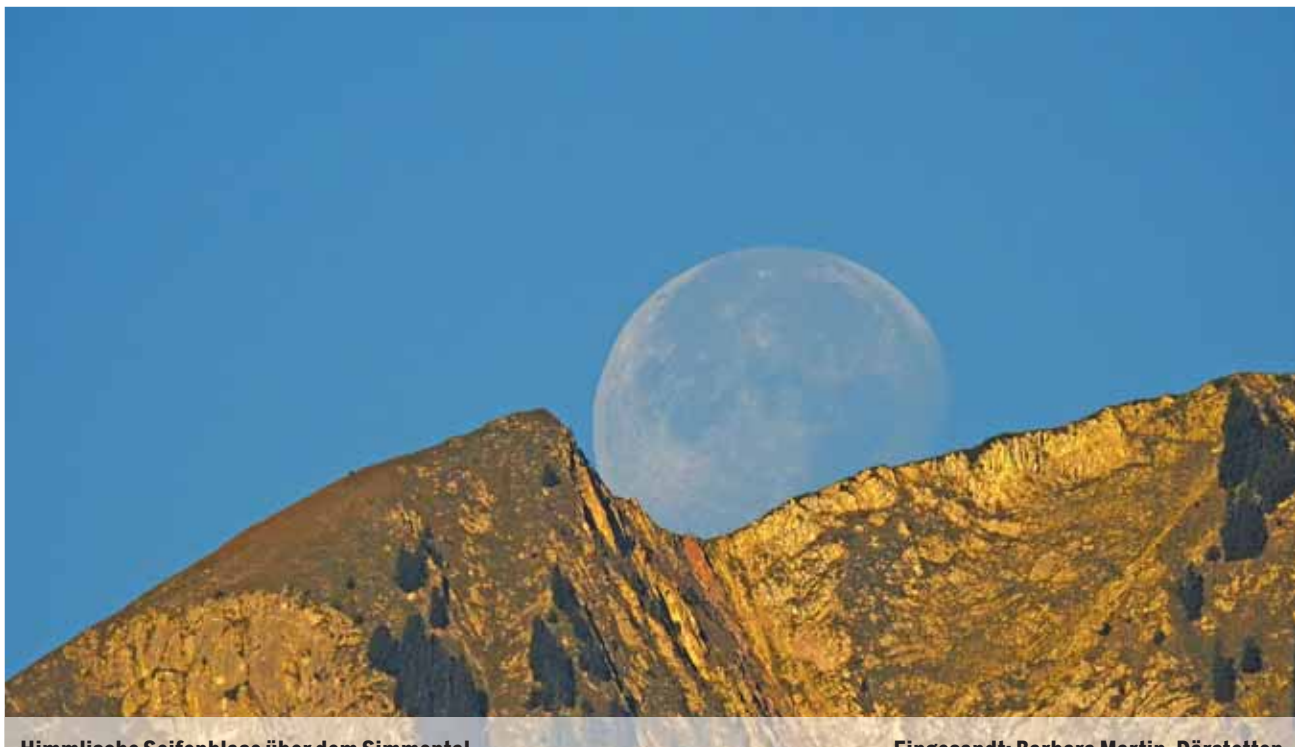
Himmliche Seifenblase über dem Simmental

Senden Sie uns ein schönes, originelles oder lustiges Bild und wir belohnen Sie mit einem Einkaufsgutschein von Coop im Wert von Fr. 30.-. Senden Sie das Bild in guter Auflösung an anzeiger@ilg.ch oder Simmentaler Anzeiger, Herrenmattstr. 37, 3752 Wimmis. Bitte mit Absender und kurzer Legende. Es wird keine Korrespondenz geführt. coop SPI-23TSXET