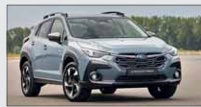
Subaru Crosstrek: Das SUV auf der Basis des neuen Impreza