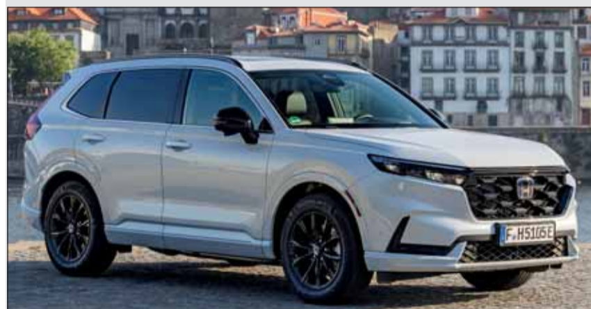
Flaggschiff: Der neue Honda CR-V ist ein beeindruckendes SUV.