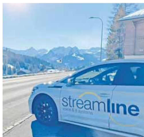
Neu anzutreffen: ein frisch gestärkter Partner mit regionaler Verwurzelung.