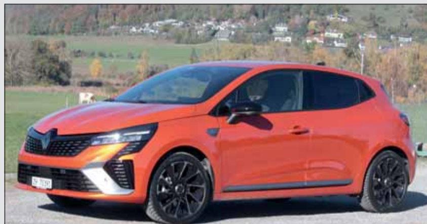
Zeitgemäss: Der neue Renault Clio ist gut gerüstet für grosse Taten.