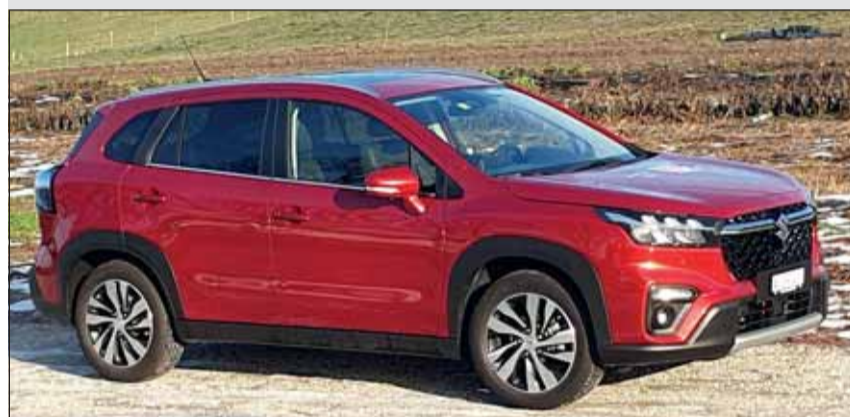
Suzuki S-Cross: Ein echter Familien-Crossover mit allen Schikanen.

Verfügung. Damit sind die Fahrleistungen ausgewogen und allen Fahrsituationen gewachsen. Das Allgrip-System bietet vier verschiedene Fahrprogramme, so dass alle vier Räder immer jene Kraft zugeteilt erhalten, die für das sichere Vorankommen nötig ist. Dabei bewegt sich der S-Cross unspektakulär, aber kontinuierlich auch abseits der Strasse, was ihn zum idealen Familien-SUV werden lässt. Das ausgereifte Konzept ist genau so bodenständig, wie das nächste eidgenössische Schwingfest im Glarnerland 2025, für das Suzuki als Königspartner auftritt. Nur einen Hosenlupf macht er nicht. Noch nicht.