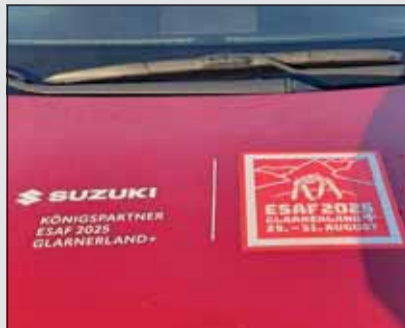
Suzuki ist Königspartner des nächsten Eidg. Schwingfestes 2025.

Der 1,5 Liter Vierzylinder wird von einem Elektromotor tatkräftig unterstützt. Ihm stehen 115 PS zur