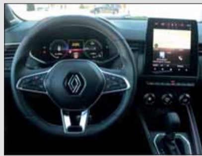
Renault Clio: Leicht überschaubares Cockpit, mit eindeutig sportlichem Einschlag.

Während bereits der Vorgänger mit Vollhybrid geordert werden konnte, hat Honda beim Neuen zusätzlich eine nachladbare Version entwickelt. Basis ist immer der 2-Liter-Vierzylinder mit Atkinsonzyklus. Ist die Batterie leer stehen 109 kW (148 PS) zur Verfügung. Die Untersetzung wird immer noch von einer stufenlosen CVT-Einheit bewerkstelligt, jetzt jedoch mit einer raffinierten Steuerung, so dass die Kraftentfaltung rasch und kontinuierlich erfolgt, ohne dass der Motor zuerst aufheult. Verantwortlich dafür ist eine zusätzliche Gangstufe, die den Honda angenehm leise fahren lässt.