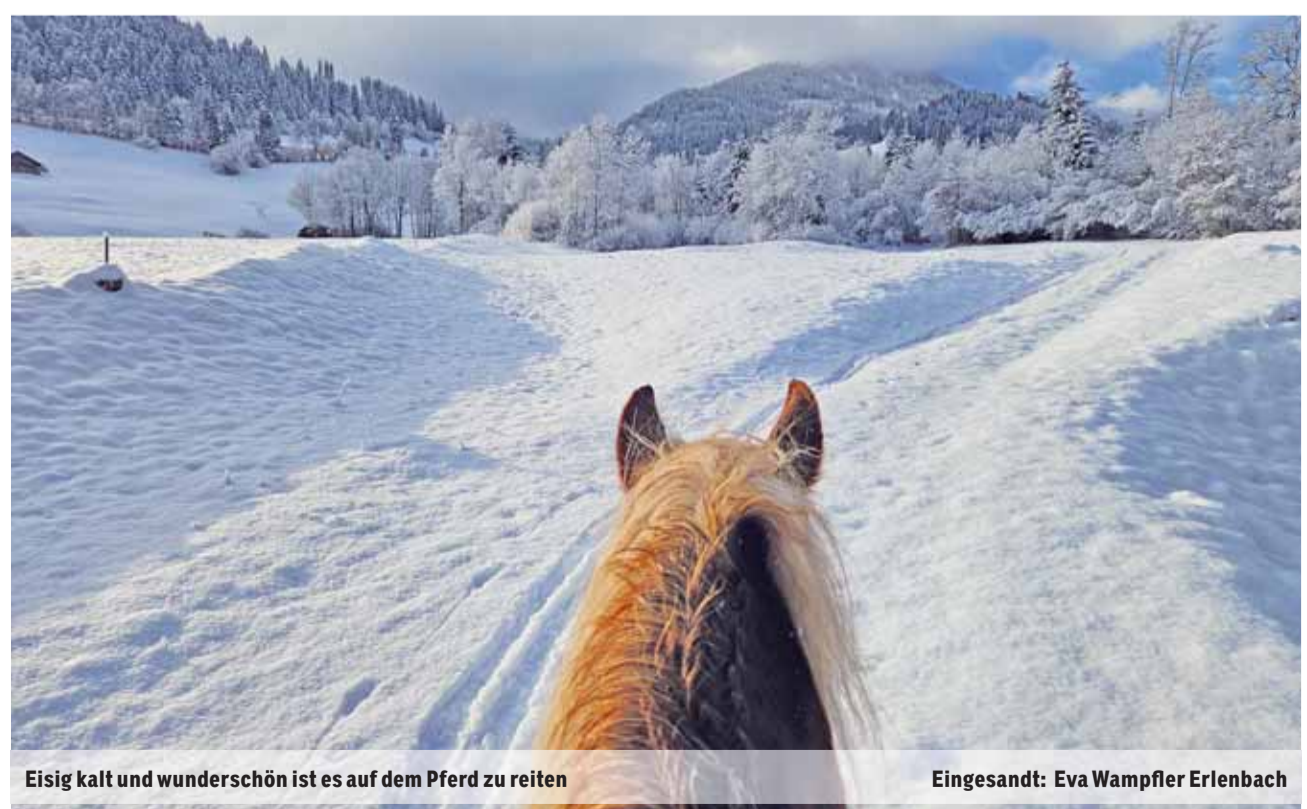
Eisig kalt und wunderschön ist es auf dem Pferd zu reiten

Senden Sie uns ein schönes, originelles oder lustiges Bild und wir belohnen Sie mit einem Einkaufsgutschein von Coop im Wert von Fr. 30.-. Senden Sie das Bild in guter Auflösung an anzeiger@ilg.ch oder Simmentaler Anzeiger, Herrenmattstr. 37, 3752 Wimmis. Bitte mit Absender und kurzer Legende. Es wird keine Korrespondenz geführt.