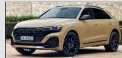
Charaktervoll: Der grosse Audi Q8 spricht eine klare Designsprache.

Audi aktualisiert das Flaggschiff der Q-Familie mit klarem Design und aufgewerteter Technik. 4-, bis 8-Zylindermotoren, die mit Benzin oder Diesel betrieben werden und bis 507 PS zur Verfügung stellen ergänzen die Elektroversion. Der Allradantrieb quattro ist meistens Serie. Die Preise starten bei Fr. 96.300.-.